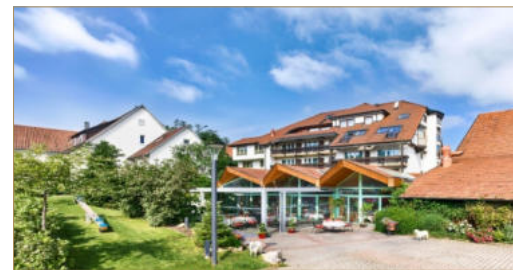
Hotel Lamm Ostfildern-Scharnhausen Tel. 07158 17060 info@lamm-hotel.net

Gerne planen wir Ihre Veranstaltung individuell Ihren Wünschen entsprechend bei einem persönlichen Gespräch.