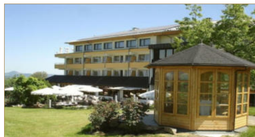
Badhotel Stauferland Bad Boll Tel. 07164 801680 info@badhotel-stauferland.de