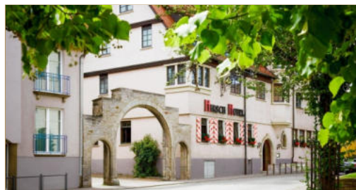
Hirsch Hotel Ostfildern-Ruit Tel. 0711 441300 info@hirsch-hotel.com